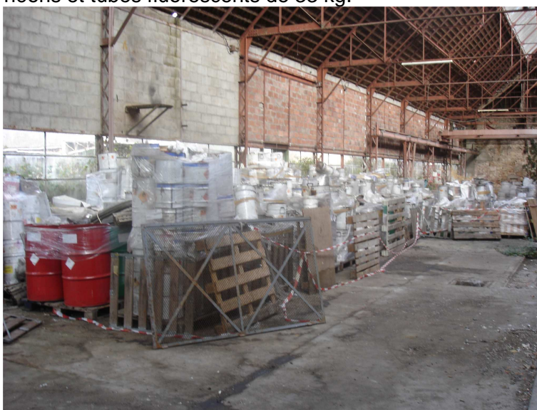
Vue d'ensemble des déchets

Les déchets courants comprennent une palette de déchets électroniques de 146 kg et une palette de néons et tubes fluorescents de 33 kg.