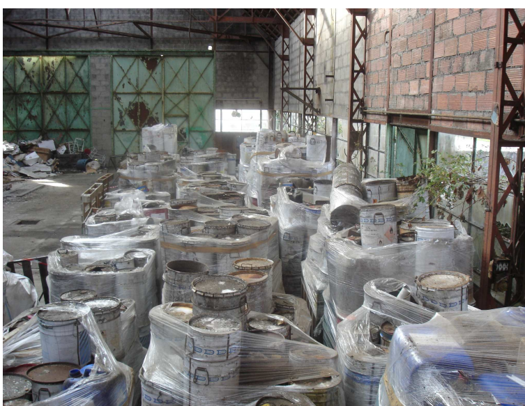
Vue prise par le dessus