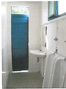
Petit local urinoirs à réaménager