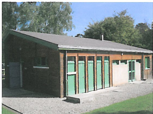
Vue façade étang comprenant une porte D'accès aux urinoirs et 4 cabines de WC au fond l'accès par porte vitrée double aux Cabines de douches