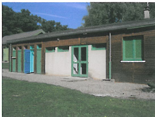
Même façade avec la porte vitrée d'accès aux douches