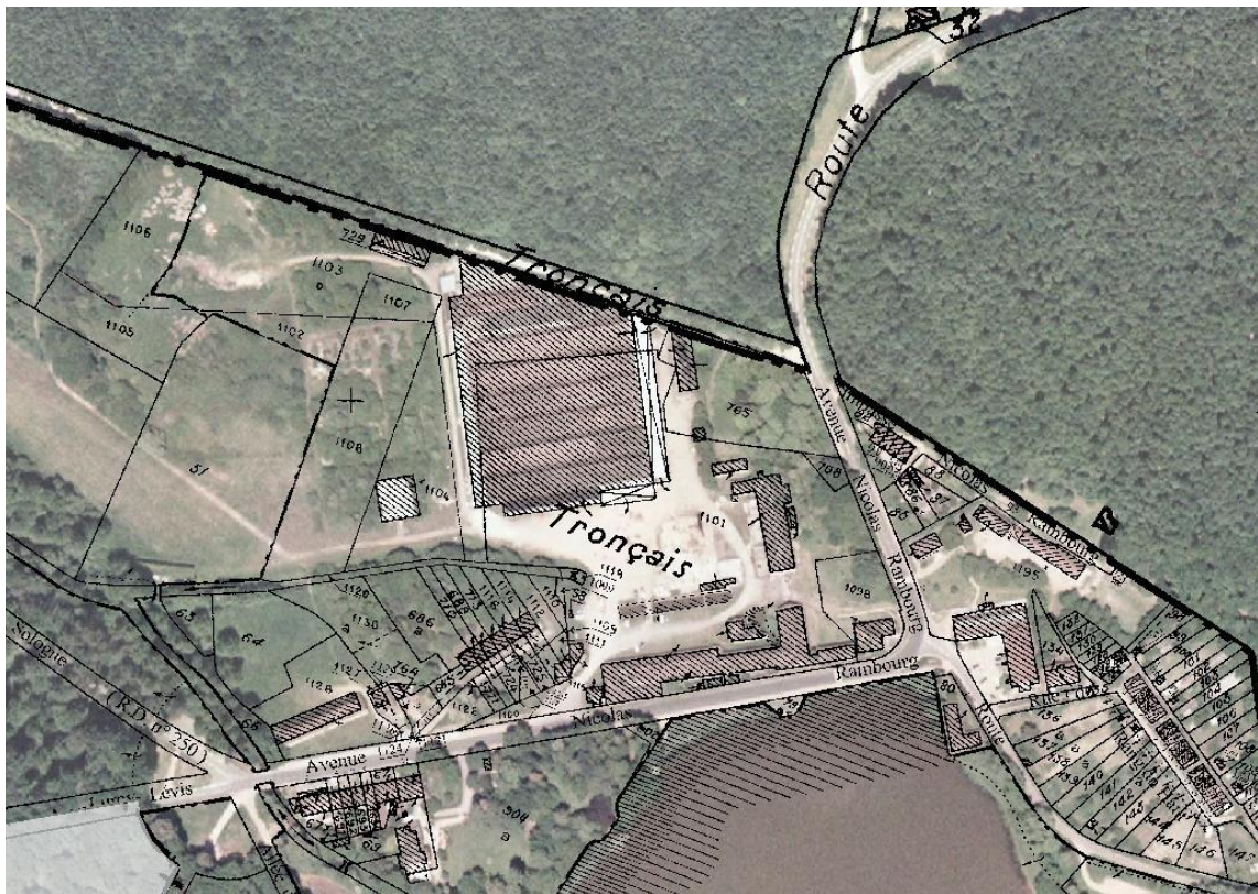
Vue aérienne des Forges de Tronçais